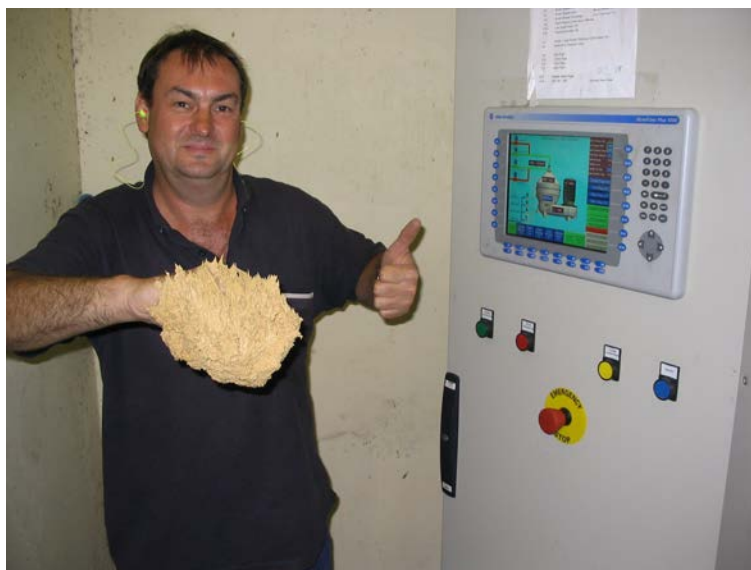
Systeme de contrôle STS200 à DISTELL GROUP-Bergkelder, Stellenbosch, Afrique du Sud

Système Éprouvé + Convivialité de L'automate = Haute Performance