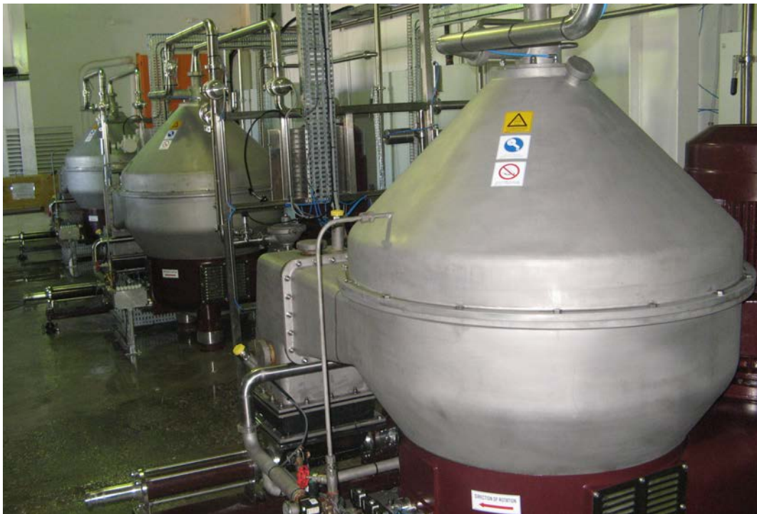
Trois (3) STS 200's à Namaqua Wines - Vredendal, Afrique de Sud

Données non contractuelles, variables selon les produits et installations.