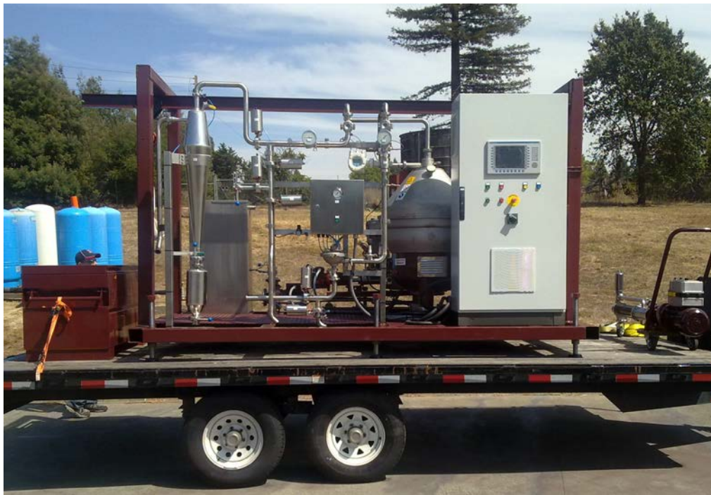
STS 45 montée sur skid pour le Service Mobile chez American Winesecrets, Napa, Californie, USA

Données non contractuelles, variables selon les produits et installations.